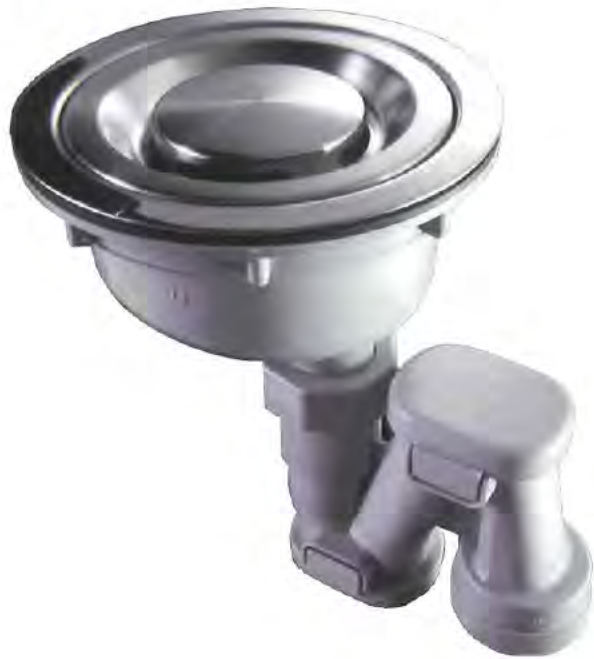
排水トラップ（本体）